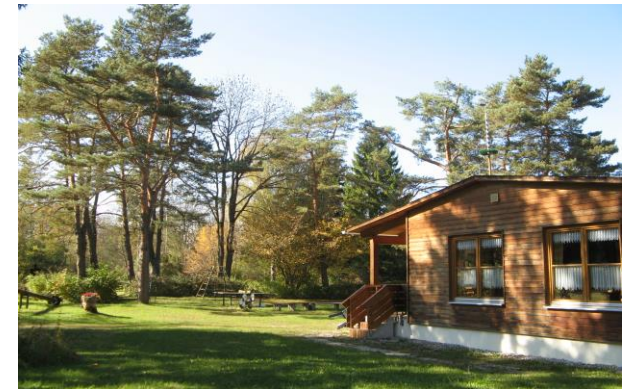
cabane du club